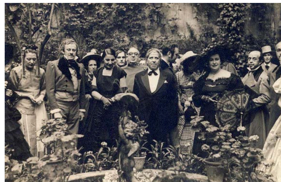
Fiesta en honor a Ramón Gómez de la Serna en el jardín del Museo del Romanticismo. 11 de mayo de 1949.