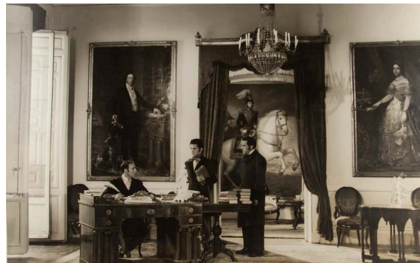
Fotograma de la película El Marqués de Salamanca , de Edgar Neville.