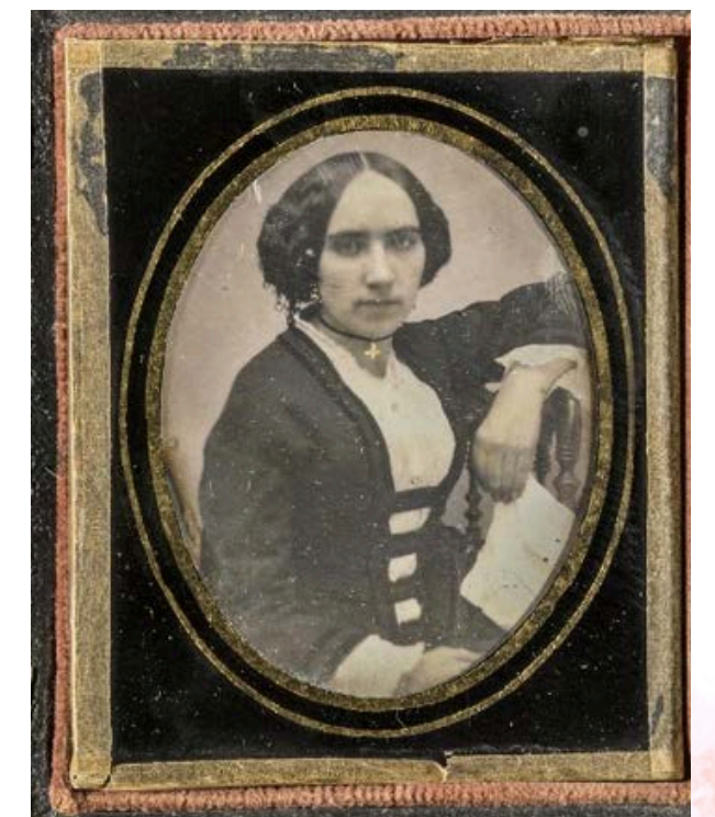
Daguerrotipo femenino donado por la Asociación de Amigos del Museo. Hacia 1850. ©José Luis Municio García. Museo Nacional del Romanticismo