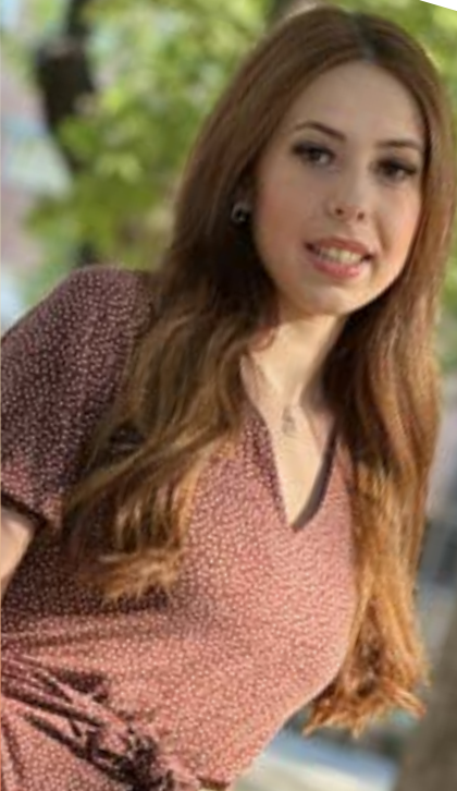
2ª Dama > Juncal Vadillo